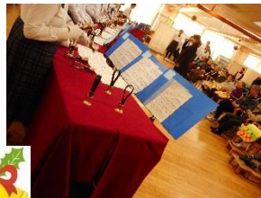
春日井高等特別支援学校の生徒さんによる ハンドベル演奏です♪