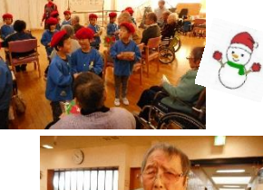
小野保育園の園児さんが 歌と劇を披露してくれました♪