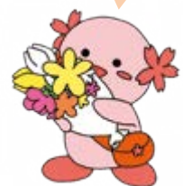
ボランティアセンター マスコットキャラクター 「ほらら」