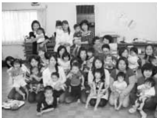
子育て支援サロン事業

5,156,000円 (14.3%) 子育て支援サロン事業 子ども会への支援 保育団体等への支援 など