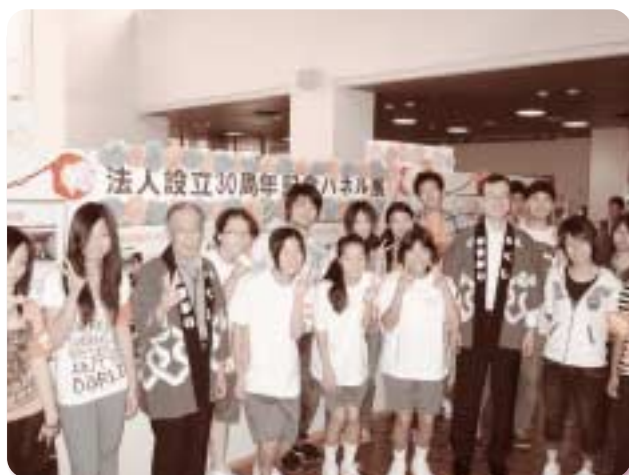
児童センターまつり ～いろいろな企画で楽しみました～