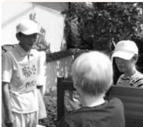
小地域ネットワーク事業

4,020,000円 (11.2%) いきいきサロン事業 小地域ネットワーク事業 老人クラブへの支援 など