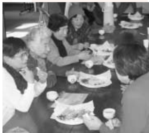
いきいきサロン事業

5,708,000円 (15.9%) 社会福祉施設の整備費 社会福祉団体の事業費 募金運動推進活動費 など