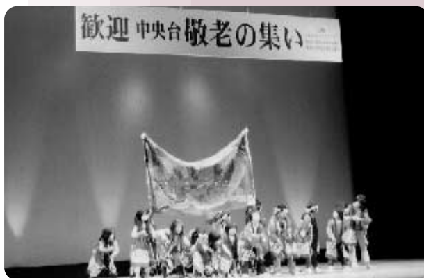
平成21年度敬老の集い（平成21年10月24日）

地域福祉育成費（会員募集の会費）をもとに、敬老の集い（70歳以上を対象に、福祉の里で平成22年10月24日予定）を開催しています。