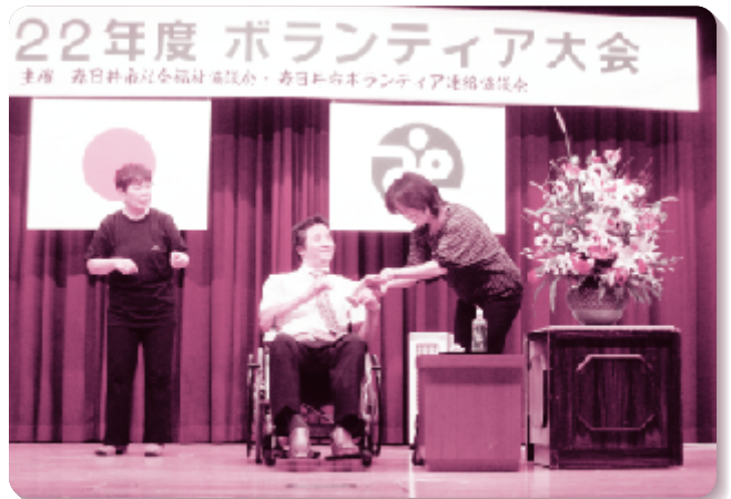
社協事業 歳時記 ボランティア大会(9月7日)