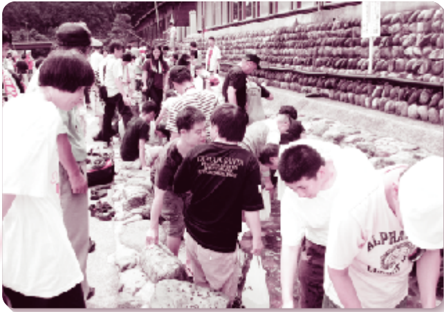
社協事業 歳時記 福祉作業所ヤナ観光旅行(8月5日)