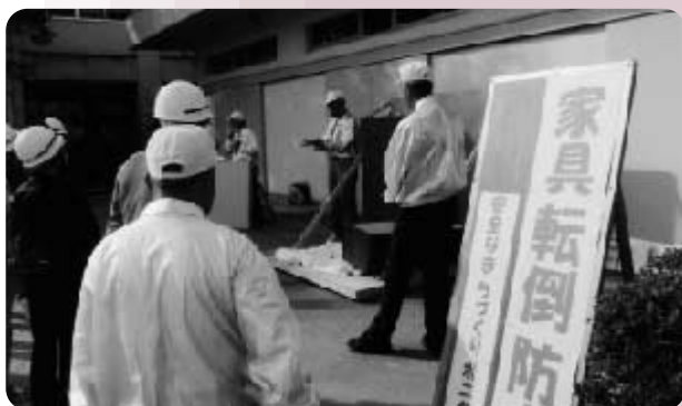
平成21年度防災訓練（平成21年11月8日）

毎年、中央台小学校PTAの皆さんと協力して、カラーリング大会（平成22年6月12日）・防災訓練（平成22年11月28日予定）・ふれあい餅つき大会（平成23年3月19日予定）を三世交代流事業として実施しています。