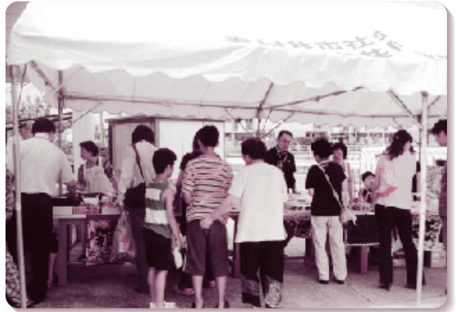
社協事業 歳時記 第一希望の家ミニバザー(8月20日)