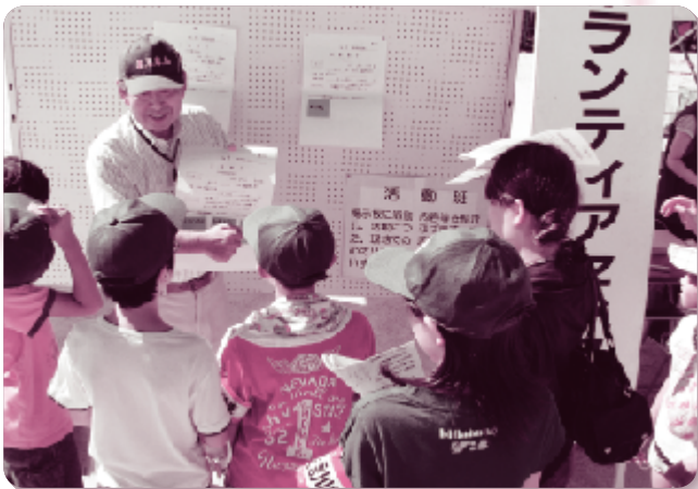
社協事業 歳時記 市総合防災訓練 (災害救援ボランティアセンター体験)(8月29日)