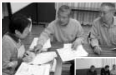
不二ガ丘見守りネット 協力員研修会

我々が見守り活動を考えるきっかけとなったのは、地元で起きた老老介護による不幸な事故によります。同じ地域に住んでいながらその状況を知ることも無く、また周囲に援助を求めることができなかったことは大きなショックでした。自分たちで何かできることが無いかを検討する中で、高齢者を対象とした見守り活動を行うことにしました。守秘義務や個人情報保護法の学習などを行い、地域住民のみなさん