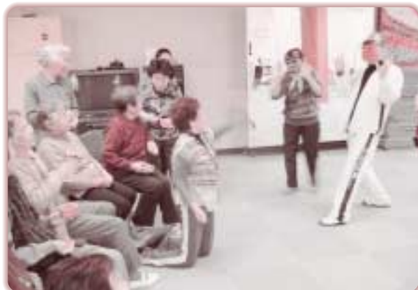
社協事業 歳時記 ふれあいデイサービス豆まき大会 (2月3日) (第1介護サービスセンター)