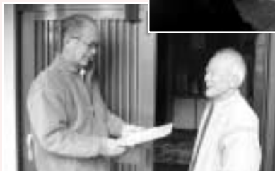
民生委員による「独り暮らし高齢者調査」