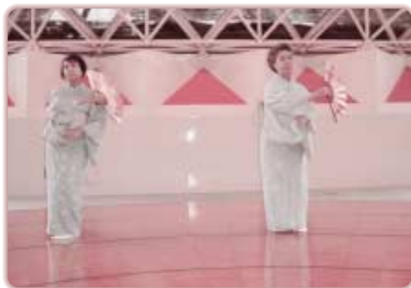
社協事業 歳時記 春日井市日本舞踊協会公演 (1月15日) (福祉の里レインボープラザ)