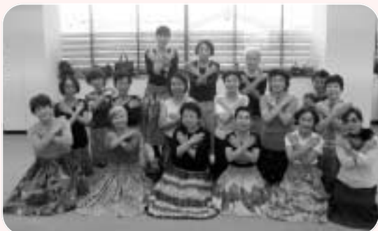
「いきいき健康フラダンス講座」受講者のみなさん

春日井市総合福祉センターは、『障がい者センター』『老人センター』『児童センター』『母子憩いの家』の4つの機能を持っている、市民のみなさんの活動をサポートする福祉活動の拠点施設です。