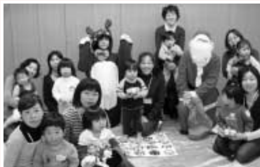
十二月はクリスマス会ヨ。

実施日時 ：毎月第3火曜日 10：00～11：30 実施場所 ：岩成台5丁目集会所