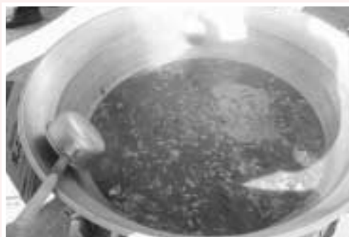
好評の芋煮。大鍋四杯がまもなく底をつきそう！