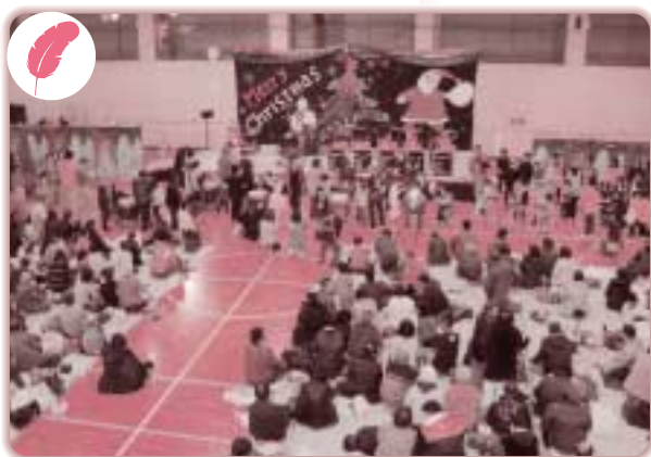
社協事業 歳時記 合同クリスマス会 (12月19日) (福祉文化体育館)