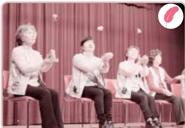
社協事業 歳時記 ボランティア研修会 (2月17日) (総合福祉センター)