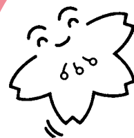
春日井市社会福祉協議会 シンボルマーク