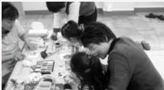
絵手紙に思い思いの絵を描く岩成台西小学校の児童たち

ご近所付き合いが希薄になっている高齢者等を、地域住民の皆さんで日常的に見守る活動が始まっています。声かけや訪問だけでなく、雨戸の開閉や洗濯物の取り込みなど、いつもと違う状況を見つけたら、安否確認を行います。市内3地区で実施中(H22年度)