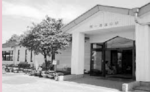
春日井市第一希望の家