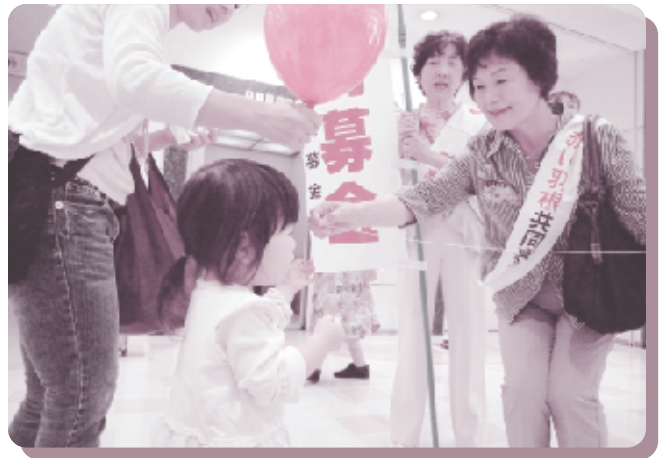
社協事業 歳時記 赤い羽根共同募金 (10月1日～)