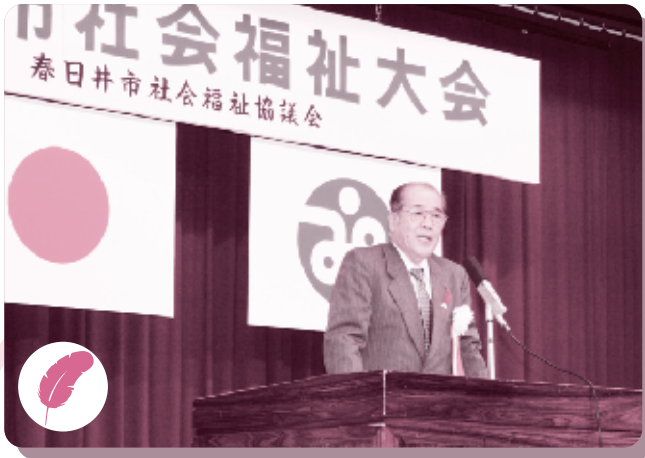
社協事業 歳時記 第57回 春日井市社会福祉大会 (11月1日)

春日井市浅山町1丁目2番61号 春日井市総合福祉センター内 社会福祉法人春日井市社会福祉協議会 (☎85-4321)