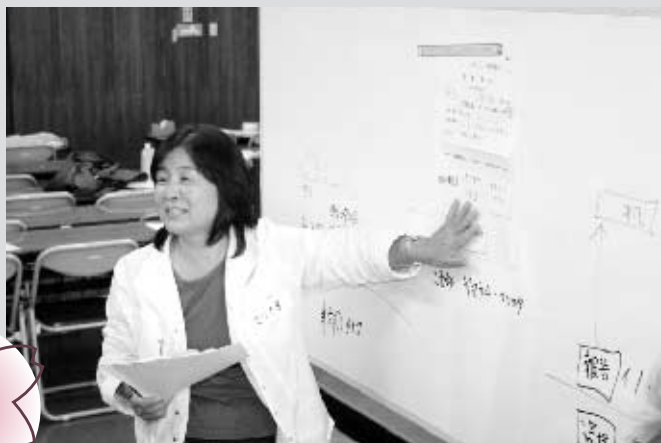
災害救援ボランティアセンター設置・運営訓練 （活動オリエンテーション）

10月20日（水）、26日（火）、11月14日（日）の3日間開催した養成講座では、「災害救援ボランティアコーディネーターの役割」などの講義や、災害救援ボランティアセンターの設置・運営訓練などを行いました。今後は、災害時のボランティアセンターの運営や防災意識の啓発などの活動に携わっていただきます。