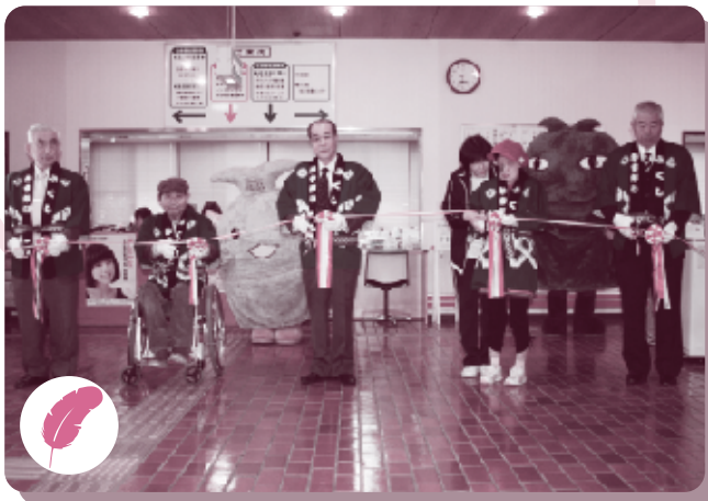
社協事業 歳時記 第30回 福祉のつどい (10月30日)