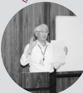
春日井市災害 ボランティアコーディネーター 連絡会の講義