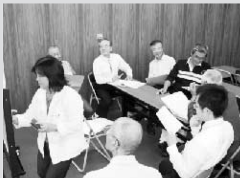
ボランティアセンター設置 レイアウトの話し合い