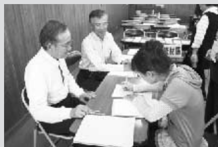
災害救援ボランティアセンター 設置・運営訓練 （ボランティア活動報告）