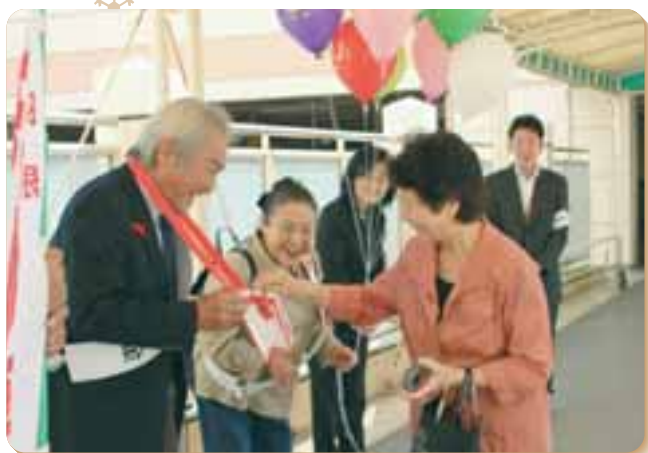
社協事業 歳時記 共同募金運動への支援 (10月1日～)