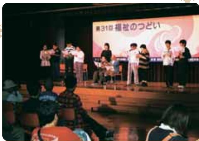
社協事業 歳時記 福祉のつどい (10月29日)