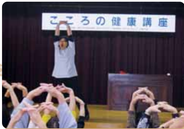
社協事業 歳時記 こころの健康講座 (11月8日)