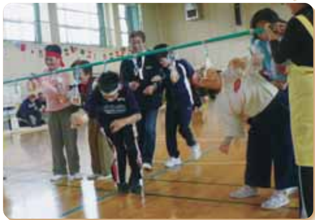
社協事業 歳時記 希望の家運動会 (11月2日)