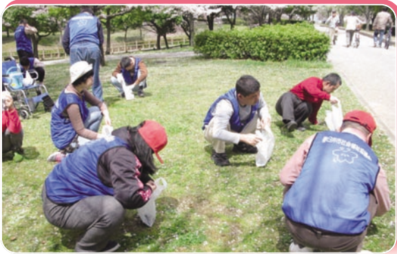
社協事業 歳時記 福祉作業所美化活動 (4月13日)