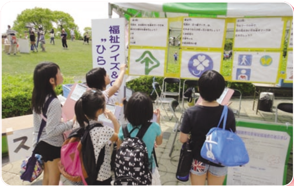
社協事業 歳時記 わいわいカーニバル (5月13日)