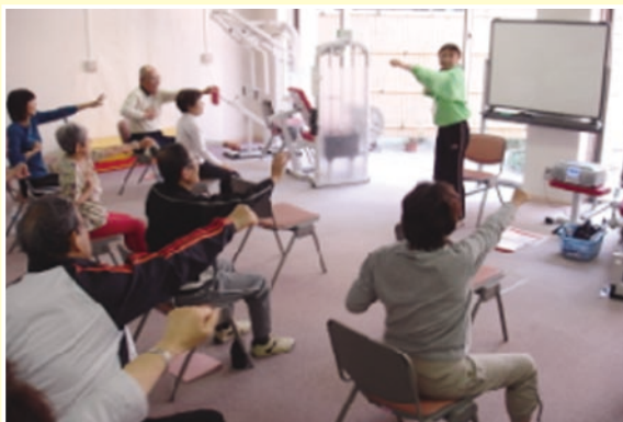
シニア運動セミナーの様子です。