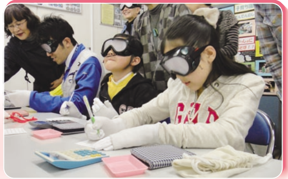
社協事業 歳時記 シルバー疑似体験 (ささえ愛センターまつり: 4月22日)