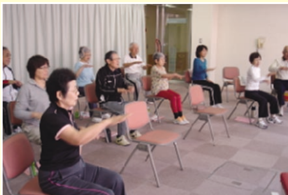
軽快な音楽に合わせて身体と頭を同時に動かしています。

運動不足や筋力低下などが原因で体力に衰えを感じている市内の60歳以上の方を対象に、4月17日から9月22日までの全23回コースで、シニア運動セミナーを開催しています。このセミナーは、閉じこもりや転倒骨折などを予防することにより、生活機能の向上を目指し、いきいきとした生活を営めることを目的に、健康運動指導士による指導のもと、ストレッチ、筋力トレーニング、有酸素運動、バランストレーニングなど行っています。前期コースを受講している皆さんも、初回に測定した体力と、半年後の体力の違いを楽しみにしていられるようです。