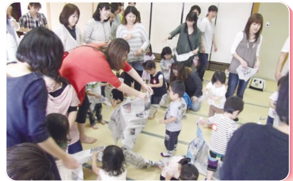
社協事業 歳時記 ひよこ教室 (5月24日)