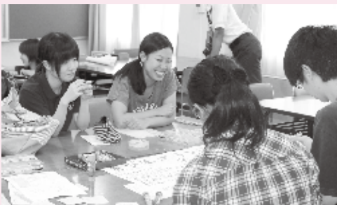
▲活動報告会の様子