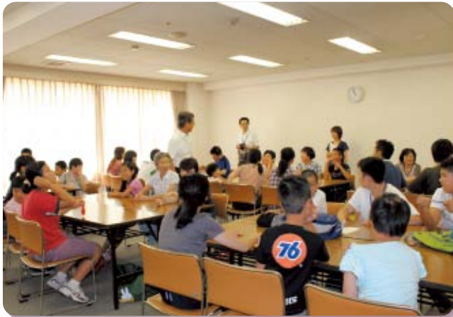
社協事業 歳時記 青少年ボランティアスクール (7月7日～8月10日)