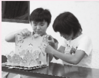
▲おもちゃ図書館はるかぜでの体験