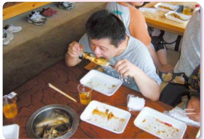
社協事業 歳時記 ヤナ招待(8月7日)