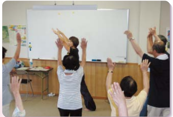
社協事業 歳時記 介護予防教室(7月20日)