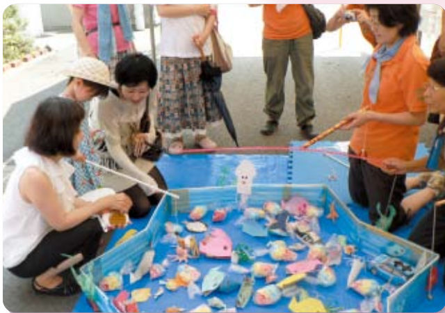
社協事業 歳時記 第二希望の家夏祭り(7月27日)