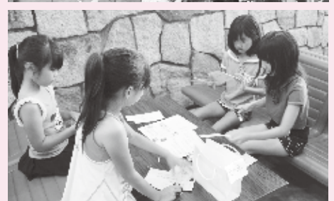
▲学生ボランティアによる 使用済み切手を切ろうコーナー