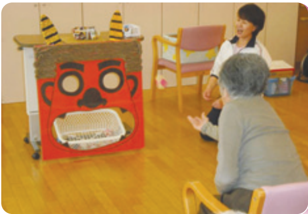
社協事業 歳時記 節分会(介護サービスセンター) (2月5日)