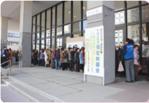
社協事業 歳時記 福祉映画会 (12月8日)