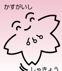
しゃきょう 春日井市社協キャラクター ひらひらちゃん