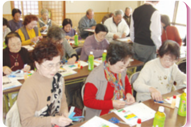
社協事業 歳時記 介護予防教室(地域包括支援センター中切) (1月29日)