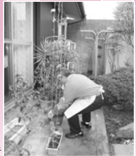
「ちょっとお助けサービス事業」植木鉢の移動活動の様子

寄せられました会費の内、約8割を、市内41か所の地区社会福祉協議会へ助成し、約2割を、ちょっとお助けサービス事業や災害救援資材の購入、地域福祉の啓発事業等の全市的な福祉事業に役立たせていただきます。