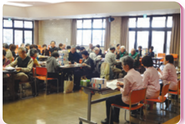
社協事業 歳時記 ふれあい連絡会(地区社協協力員研修会) (2月13日)