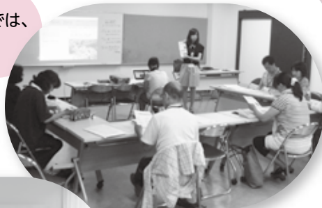
◀▲ボランティアや傾聴について学びました。