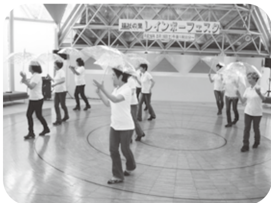
8月16日 ダンスの広場

19日からのあそびの広場では、牛乳パックを使ってボートやこまを作り親子で遊ぶ姿が見られました。