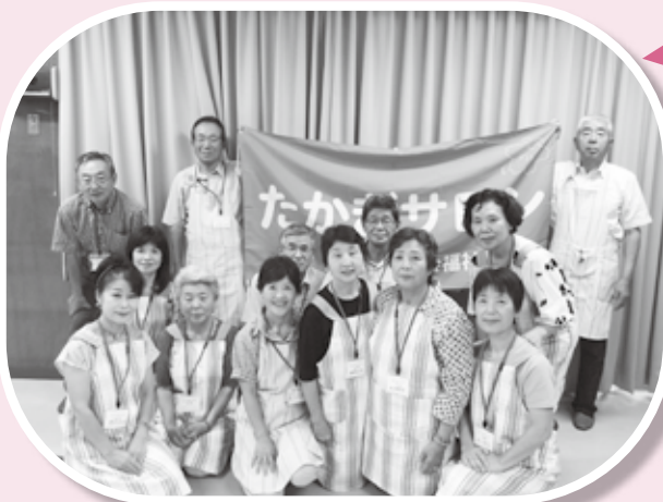
サロン協力員の皆さん (26.8.20撮影)

5月から「たかぎサロン」がスタート。毎回、参加者と協力員が和気あいあい、いきいき体操、健康講座、ゲームなど、楽しいひとときを過ごしています。協力員は参加者の皆さんを笑顔で迎え、そして笑顔で送り出すことをモットーとしています。