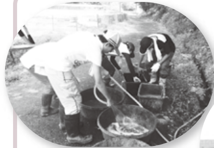
▲げんき牧場では、馬の世話などを体験しました。

7月・8月に、ボランティアについて学ぶ、 青少年ボランティアスクール を開催! 9人の学生が修了し、延べ44か所で活動をしたよ!