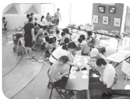
8月19日～23日 あそびの広場