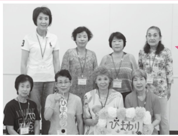
サロン協力員の皆さん (26.7.2撮影)