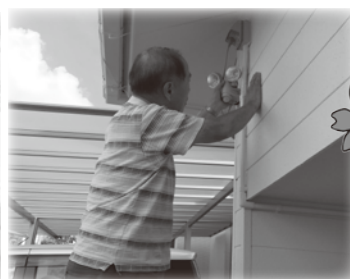
◆ ちょっとお助けサービス事業