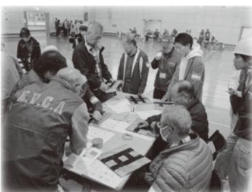
◆ 災害救援ボランティア体験研修会