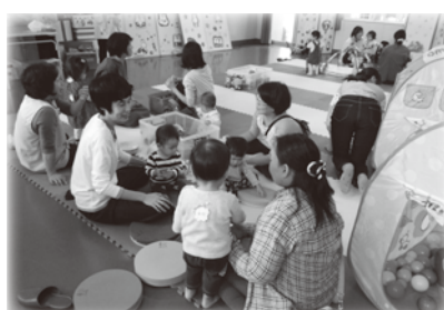
◆ 地区社会福祉協議会が行う子育て支援サロン