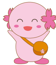
「ぼらら」 ボランティアセンター マスコットキャラクター